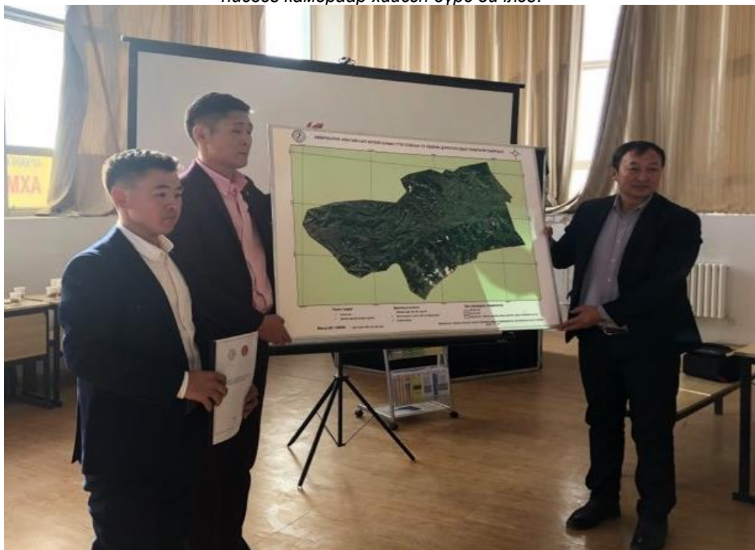
Зураг 4. Судалгааны ажлын тайлан болон бусад материалуудыг хүлээлгэн өгч буй байдал.