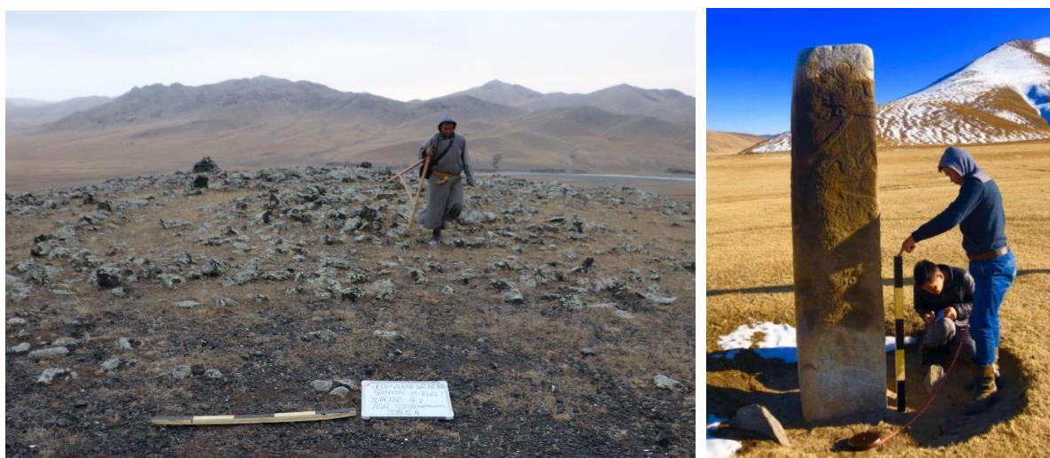
Зураг 1. Түүх, соёлын үл хөдлөх дурсгалын бүртгэн баримтжуулалт, хайгуул судалгааны ажлын явц.

Дэлхийн Өв-Орхоны Хөндийн Соёлын Дурсгалт Газрын хамгаалалтын захиргаа, Өвөрхангай аймгийн Бат-Өлзий сумын ЗДТГ, Соёлын төвтэй хамтран 2019 оны 10-р сарын 11-ноос 10-р сарын 16-ны хооронд Бат-Өлзий сумын түүх, соёлын үл хөдлөх дурсгалуудын мониторинг тандан болон археологийн хайгуул судалгаа явуулж, Монгол улсын түүх, соёлын үл хөдлөх дурсгалт зүйлийн бүртгэлийн маягтын дагуу бүртгэн баримтжуулалтыг сайжруулахад арга зүйн зөвлөгөө өгч хамтран ажиллаа.